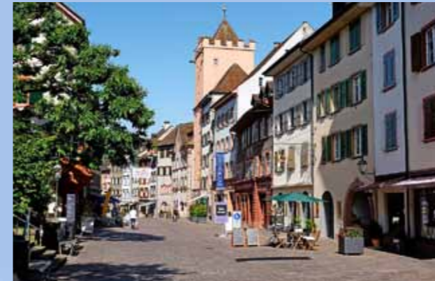
Die Markt-gasse ist verkehrsfrei und mit ihren Boutiquen und Café-Restaurants eine ideale Flaniermeile.

Braucht man eine Stärkung, bieten sich genug einladende Gelegenheiten. Bierliebhaber werden nostalgische Gefühle entwickeln angesichts der reich bemalten Fassade «Brasserie zum Salmen, bis 1834 Braustätte des Rheinfelder Urbräu» – das war einmal. Heute kommt das Bier von Feldschlösschen, der markante Bau ist auch ein Wahrzeichen von Rheinfelden. ✿