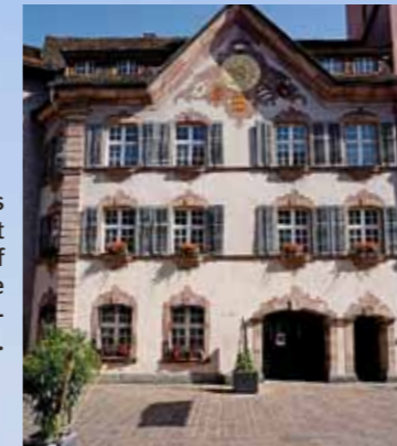
Die Barockfassade des Rathauses stammt von 1769, im Innenhof hat es eine gotische Freitreppe und Wandmalereien.